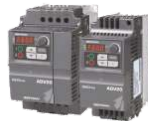
Charakterystyka - falowniki ADV20 / ADV50

Standardowo falownik wyposażony jest w panel sterujący KB z wyświetlaczem i potencjometrem, umożliwiającym wprowadzanie danych, zmianę parametrów, prędkości, funkcje RUN/Stop.