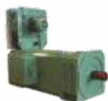
SILNIKI PRĄDU STAŁEGO 0,55 - 4000 kW

Autoryzowany serwis 24h Zaufaj naszemu doświadczeniu